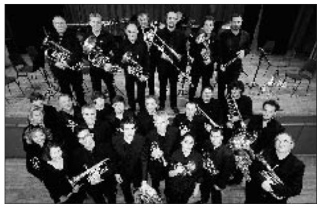
Le Brass band de Charente.