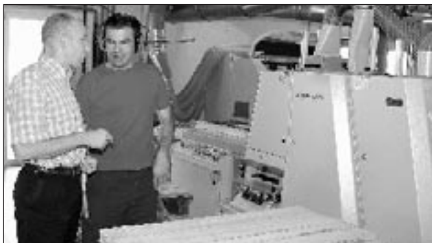
« La suprême récompense du travail n'est pas ce qu'il permet de gagner mais ce qu'il nous permet de devenir ». Dans l'atelier bois de l'Esat de La Merci, le message de l'Arche se vit au quotidien.

L'Arche s'intègre non seulement dans la vie du diocèse avec des célébrations eucharistiques hebdomadaires mais aussi dans la société.