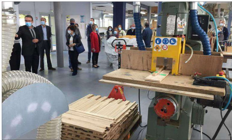
Chaque poste est désormais bien identifié. Le nouvel atelier bois offre plus de sécurité aux travailleurs.

Validés par le conseil d'administration, financés par L'Arche mais aussi quelques partenaires, parmi lesquels l'Agence régionale de santé, les travaux ont