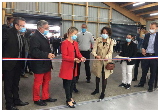
Le chantier s'est terminé en mars. En raison du covid, l'atelier n'a été inauguré qu'hier.

A noter que L'Arche La Merci fête ses 50 ans, cette année. Il s'agit de la deuxième communauté créée en France. Son Esat, Établissement et service d'aide par le travail, emploie 56 personnes sur trois ateliers: le bois, les espaces verts et la sous-traitance.